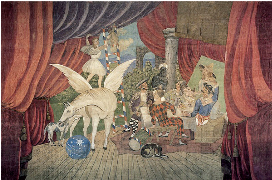
Picasso- Le Rideau de parade