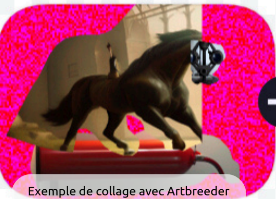
Exemple de collage avec Artbreeder