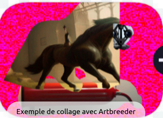
Exemple de collage avec Artbreeder